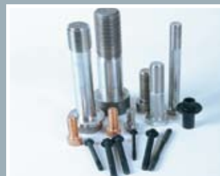
冷锻钢丝带来值得回馈的客户关系

我们一直着眼未来和发展值得回馈的客户关系。我们已为很多客户提供冷锻钢丝超过30年、彼此获得可持续发展的双赢关系。