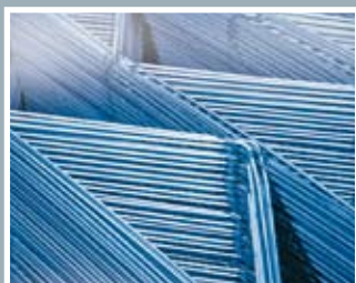
专门设计的拉制钢丝

在与客户和领先级的研发中心合作中、我们开发新品进行技术创新。我们的技术团队与客户紧密合作、使我们的产品满足了客户的不断变化的需求、应用和生产工艺。法格斯塔不锈钢的经验、承诺和服务使其成为硬软实力兼备的世界级制造商。