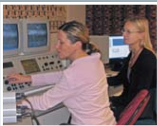
客户的需求是研发新线材的动力