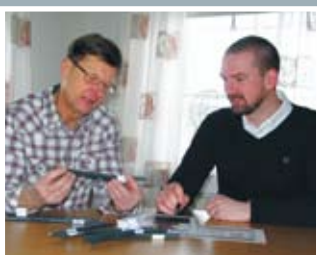
吸引一代又一代的专业人员

客户的成功就是我们的成功。因此、我们确保我们的产能和能力符合高标准、与客户合作开发新品和新的生产工艺。综上所述、我们为客户提供最好的产品、使其在业内拥有良好的声誉并不断的发展壮大。