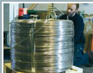
方便加工的 包装形式