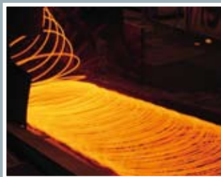
新型不锈钢产生新型焊接消耗品