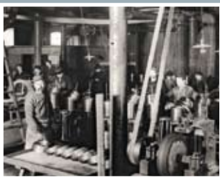
在1921年我们提供不锈钢给第一个客户

另一个在与客户协作开发新品的案例：传送带用的钢丝要求能承载重物并且环境要求极其苛刻、通过与客户的共同协作、法格斯塔不锈钢取得了突破性的成果、开发出一种独特抗腐蚀性和力学性能的新品、并且其使用寿命延长了3倍。这是与客户互相协作、互相信任的结果。