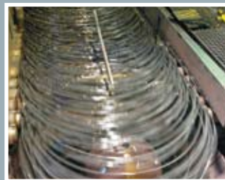
质量控制贯穿生产过程的始终