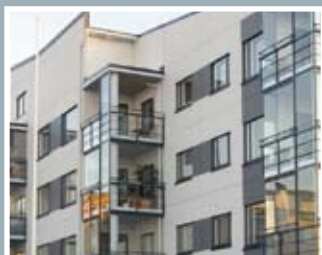
用于工厂、建筑、汽车和飞机

法格斯塔不锈钢生产的直径1.5-12mm的各型拉制钢线、直径公差和表面处理都是按不同客户要求生产的。